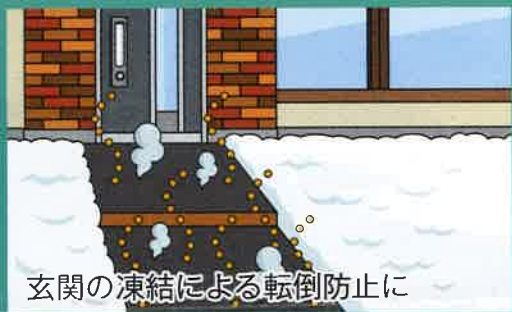
玄関の凍結による転倒防止に