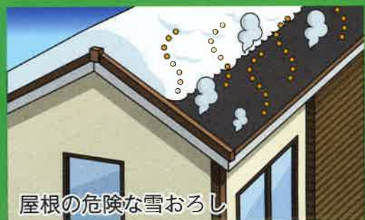
屋根の危険な雪おろし