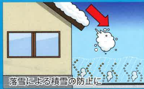
落雪による積雪の防止に